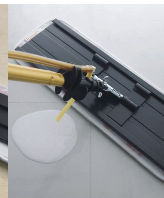
System Easy Shine

Odkurzanie Easy Trap Czyszczenie na mokro Easy Scrub Nakładanie powłok Easy Shine