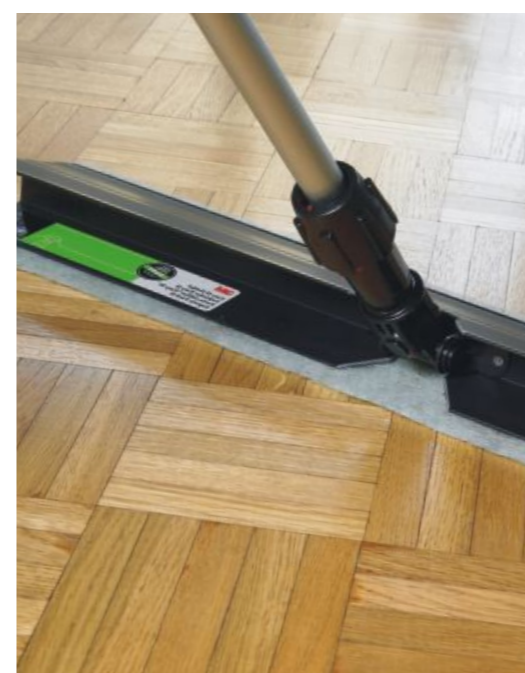
System Easy Trap