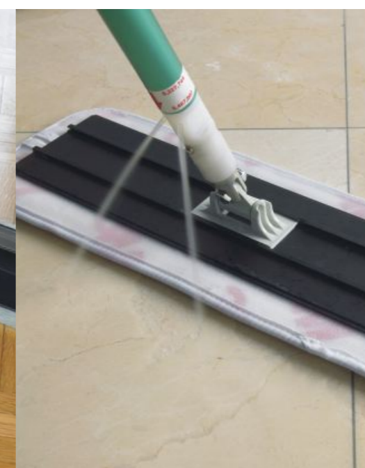
System Easy Scrub